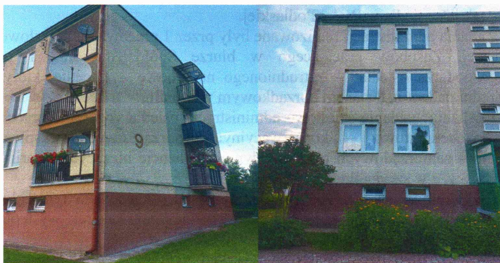
Osiedle w Janowie Podlaskim budynki mieszkalne przy ulicy 1-go Maja 9 i 11

Osiedle to wzniesiono w latach 1976-1979. Pod jego budowę przeznaczono teren o powierzchni 3 227 m 2 na którym powstały 2 budynki mieszkalne trzykondygnacyjne z 4 klatkami schodowymi i 36 lokalami mieszkalnymi . Pierwszy w osiedlu budynek przy ul. 1 Maja 11 oddano do użytku 15 stycznia 1978 roku, a drugi przy ul. 1 Maja 9 w dniu 31 stycznia 1979 roku.